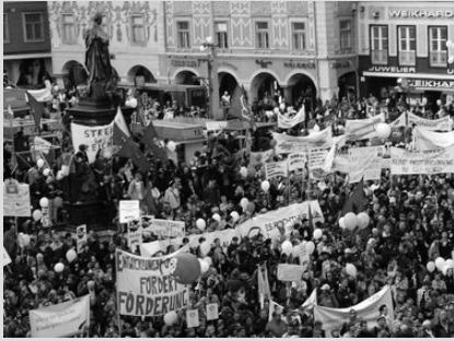
plattform25 Demo gegen Sozialabbau